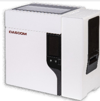
Modell mit 2. Schacht

DASCUM Europe GmbH Heuweg 3 | 89079 Ulm | GERMANY Tel.: +49 731 2075-0 | Fax: +49 731 2075-100 info@dascom.com | www.dascomeurope.de