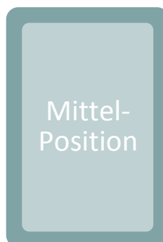
Eindruckpositionen auf CR-100 Karten