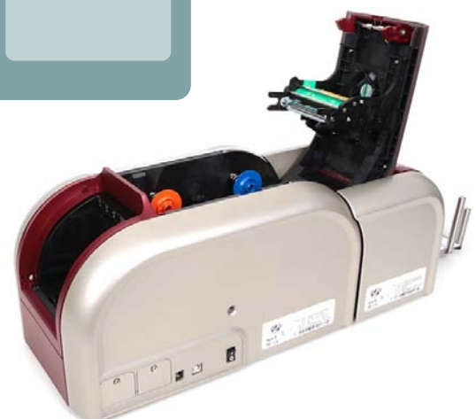
2XCR 100 mit optionaler Wendestation