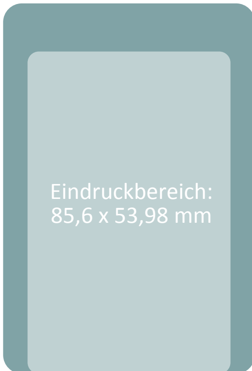
CR-100 Kartenformat in Originalgröße